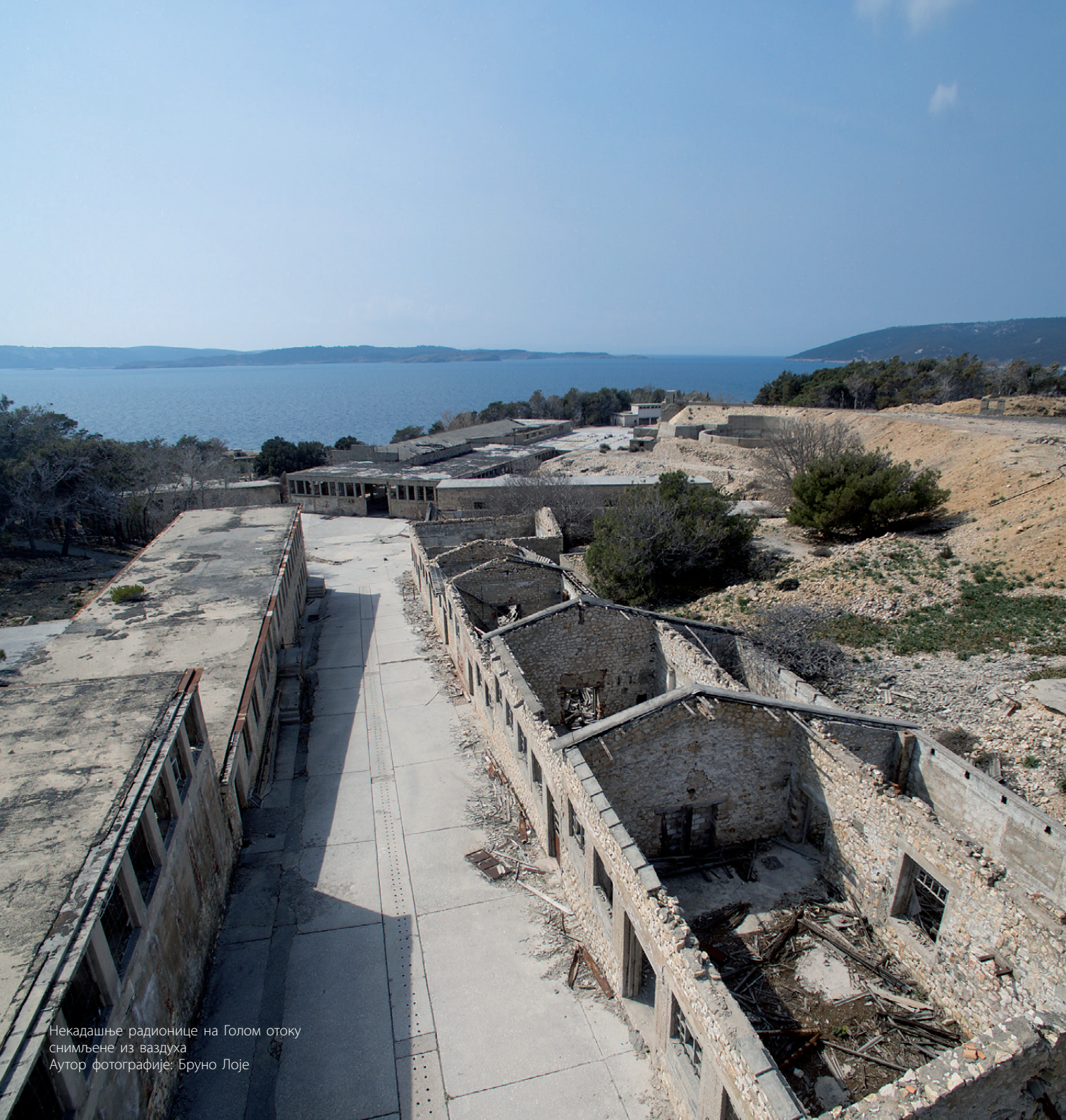
Некадашње радионице на Голом отоку снимљене из ваздуха