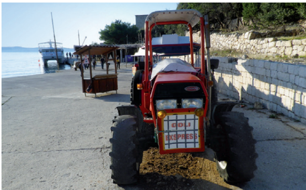
Пристаниште на Голом отоку 2018.

Позитивно је да се представници власти или барем њихове изасланици са венцима могу видети на годишњим комеморацијама на Голом отоку. Представници политичких институција Републике Хрватске посећују Голи оток најчешће 23. августа поводом Европског дана сећања на жртве свих тоталитарних и ауторитарних режима. Међутим, између слања изасланика са венцем и изградње музејско-едукацијске инфраструктуре са квалификованим особљем и програмима дуг је пут који захтева значајна улагања те спремност различитих политичких и друштвених актера да подрже тај процес.