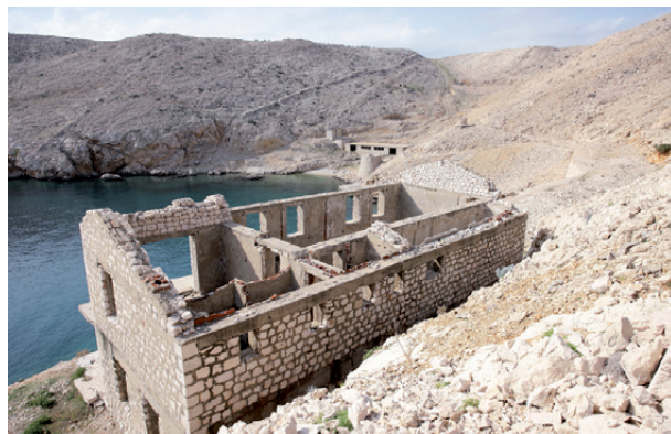
Остаци женског логора на Голем отоку

Након тога жене су пребачене у логор на острво Свети Гргур где су провеле око годину дана, од априла 1950. до априла 1951. године, да би потом биле пребачене на Голи оток у логор имена „Радилиште 5“ (Р-В). Ту су провеле такође годину дана. Током овог времена, иако су биле на острву заједно са мушкарцима нису биле у контакту са њима. Према сведочењима бивших логораша и логорашаца, само понекад су једни друге видели издалека. Женски логор на Голем отоку био је на посебно неприступачном месту које је имало посебно лоше временске услове јер је био изложен сталним налетима ветра. Слично управној структури мушких логора, испеднице су биле жене, а животи и радни услови били су тешки. Након Голег отока логорашаца су пребачене поново на суседно острво Свети Гргур где су дочекале распуштање логорског система и излазак на слободу.