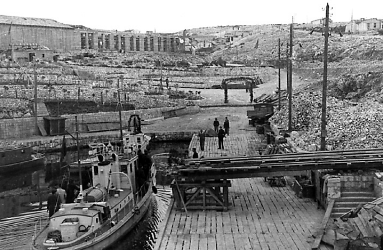
Пристаниште на Голем отоку

„Пристаниште“ је остало у лошем сећању логораша јер је близу њега почињао шпалир, дворед логораша, који је понекад бројио и више од хиљаду људи кроз који су новопридошли логораша пролазили и бивали тучени. Забележени се бројни смртни случајеви логораша који нису издржали шпалир.