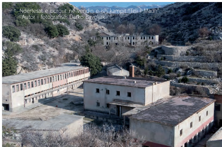
Ndërtesat e burgut në vendin e ish kampit “Teli i Madh”