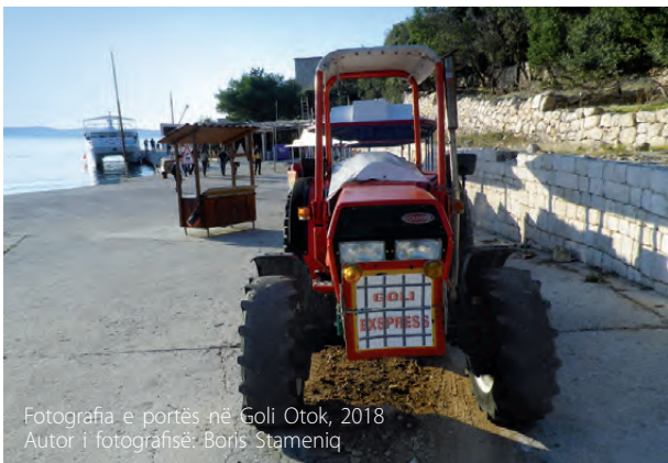
Fotografia e portës në Goli Otok, 2018

Është pozitive që zyrtarët qeveritarë, ose të paktën të dërguarit e tyre, mund të shihen në përvjetorët përkujtimor në Goli Otok. Përfaqësuesit e institucioneve politike të Republikës së Kroacisë vizitojnë Goli Otok më së shpeshti më 23 gusht, me rastin e Ditës Ndërkombëtare të Përkujtimit për Viktimat e Regjimeve Totalitare dhe Autoritare. Megjithatë, midis dërgimit të përfaqësuesve me një kurorë lulesh dhe ndërtimit të një muzeu dhe infrastrukture arsimore me personel dhe programe të kualifikuar, ka një rrugë të gjatë që kërkon investime të konsiderueshme dhe gatishmëri të palëve të ndryshme politike dhe shoqërore për të mbështetur këtë proces.