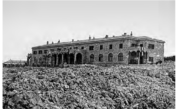
Fotografia e ndërtesës së ashtuquajtur "Hoteli"

Ndërtesa e ashtuquajtur "Hoteli" është ndërtuar gjatë vitit 1950 dhe ka shërbyer si objekt banimi për hetuesit, anëtarët e UDBA-së (kati i parë), një hapësirë tjetër ku merreshin në pyetje të burgosurit dhe mensa (kati përdhes). Pylli që rrethon ndërtesën e "Hotelit" është rezultat i pyllëzimit që filloi në vitin 1950. Krijimi i kampit nuk ndikoi vetëm në të burgosurit, por ndryshoi edhe mjedisin në Goli Otok. Hapësira përpara ndërtesës fillimisht ishte një shkëmb i zhveshur, siç shihet në fotografi. Administrata e kampit dëshironte të pyllëzonte Goli Otokun, ose të paktën ato pjesë të ishullit ku pyllëzimi ishte i mundur. Dheu u soll nga ishujt e afërt dhe u përdor për të mbjellë pemë, kryesisht pisha. Edhe në këtë rast, policia sekrete ndërthuri riedukimin politik me punën e detyruar. Të burgosurit duhej të qëndronin në një vend për orë të tëra, në mënyrë që të mbronin fidanët nga dielli i fortë.