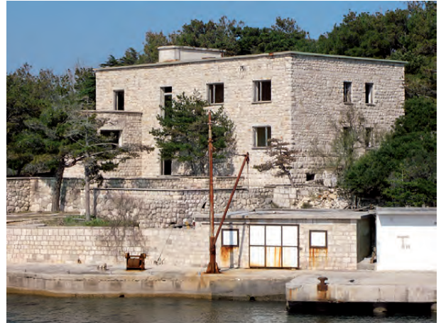
Fotografia e Ndërtesës prej Guri

Ndërtesa prej guri është ndërtesa e parë prej guri e ngritur në Goli Otok. Ajo u ndërtua në vitin 1949 nga të burgosurit për nevojat e vendosjes së administratës së kampit dhe hetuesve. Pas përfundimit të ndërtimit të një objekti të ri dhe më të madh për të vendosur administratën dhe hetuesit në vitin 1950 (shih pikën 2), ndërtesa prej guri u përdor për të strehuar rojet. Në periudhat e mëvonshme, ndërtesa prej guri shpesh ndryshonte funksionin e saj.