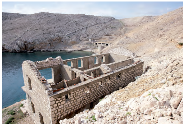
Fotografia e mbetjeve të kampit për gra në Goli Otok