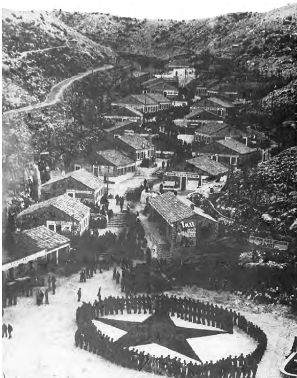
Fotografia e kampit “Teli i Madh”

Me rritjen e numrit të informbyroistëve të burgosur, numri i të burgosurve në Goli Otok gjithashtu u rrit. Kështu që kapacitetet e strehimit në kampin e parë “Teli i Vjetër” ishin të pamjaftueshme, dhe administrata e kampit vendosi të ndërtojë një kamp të dytë më të madh, të njohur si “Teli i Madh” ose ndonjëherë përdorej vetëm si “Teli”. Kampi u ndërtua në vitin 1950 dhe kishte më shumë se 20 pavijone prej guri dhe secili mund të strehonte rreth 250 të dënuar. Kampi “Teli i Madh” ishte i rrethuar me tela me gjemba dhe kulla vrojtimi, si dhe kishte një mol të vogël. U ndërtuan gjithashtu ndërtesa për seksionin kulturor, kuzhina, depo dhe objekti mjekësor. Pas mbylljes së kampit, “Teli” u rindërtua dhe u krijua burgu korrektues në Goli Otok. Ndërtesat origjinale të vitit 1950, siç shihen në fotografi, janë shkatërruar. Pamja e sotme e vendndodhjes së “Telit” kryesisht pasqyron pamjen e burgut nga dekadat e mëvonshme.