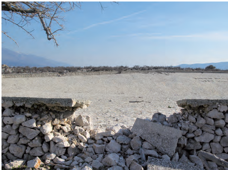
Fotografija rezervoarja za vodo

Poleg tega, da so bili taboriščniki včasih kaznovani z majhnimi porcijami vode, je bilo na Goli otok logistično težko dostaviti vodo. V ta namen je obstajal vodni nosilec »Izvir«, ki je taborišče oskrboval z vodo. Eden izmed načinov za premišljeno reševanje težave s pomanjkanjem vode na otoku je bila izgradnja velike poplavne ravnice, kjer se je zbirala deževnica.