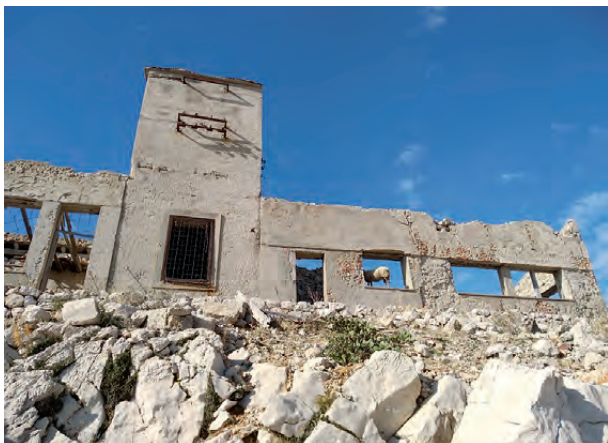
Fotografija gradbenega objekta na Golem otoku leta 2018

Dejstvo je, da so bili nekateri taboriščniki na Golem otoku goreči zagovorniki Stalina, kar otežuje situacijo s priznavanjem statusa žrtev in tistim zapornikom, ki so končali na Golem otoku samo zato, ker jih je nekdo zlonamerno obsodil kot domnevne zagovornike Resolucije Informbiroja. Politične elite komunistične Jugoslavije so skušale prikriti ali upravičiti politično represijo nad nasprotniki, kar deloma pojasnjuje ambivalenten odnos do Golega otoka v socialistični Jugoslaviji. Molk, samovoljna konstrukcija upravičenosti in obrekovanje političnih nasprotnikov so legitimizirane strategije v kateri koli diktaturi.