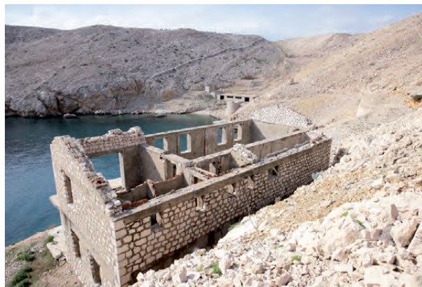
Fotografija ostanka ženskega taborišča na Golem otoku

Žensko taborišče na Golem otoku je bilo v posebej nedostopnem kraju, ki je imelo še posebej slabe vremenske razmere, ker je bilo izpostavljeno nenehnim sunkom vetra. Podobno kot v upravni strukturi moških taborišč so bile preiskovalke ženske, življenjski in delovni pogoji pa težki. Po Golem otoku so bile taboriščnice spet premeščene na sosednji otok Sveti Grgur, kjer so dočakale razpad taboriščnega sistema in svojo izpustitev na prostost.