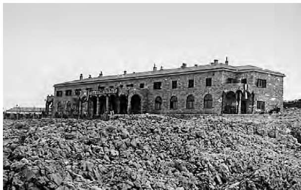
Fotografija zgradbe t. i. »Hotela«