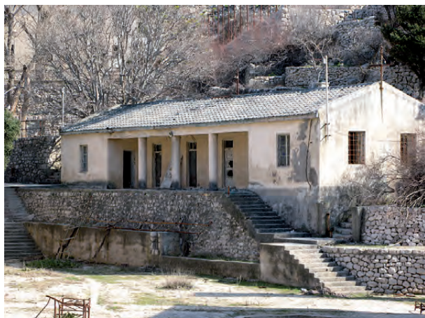
Fotografija zgradbe Centra taboriščne samouprave Avtor: Darko Bavoljak

Taborišče na Golem otoku je imelo posebno upravno strukturo. Sama UDBA, jugoslovanska tajna policija, v samem taborišču skorajda ni bila prisotna. Vzpostavila je sistem taboriščne samouprave, kjer so privilegirani taboriščniki upravljali druge kaznjence. Vzpostavljen je bil celoten sistem privilegijev in notranje taboriščne hierarhije, ki je bil vzvod za »politično prevzgojo«. Zgradba »Centra«, vrha taboriščne samouprave, je ena izmed redkih verodostojnih zgradb v »Žici«. Tam so vodje taboriščne samouprave usklajevali naloge, prejete od Udbe, izvajali delovne načrte ali sprejemali taboriščnike in sodelavce. Ta kraj je bil med taboriščnimi prebivalci še posebej osovražen. Taboriščniki so se namreč dobro zavedali, da so privilegirani taboriščniki, nastanjeni v »Centru«, podaljšana roka UDBe. Vodstvo »Centra« je imelo številne privilegije, o katerih so navadni taboriščniki lahko samo sanjali: postelje, neomejeno hrano in pijačo ter celo alkohol. Ni jim bilo treba delati, vendar so ukazovali. Podobne organizacijske modele, kjer so taboriščniki upravljali druge taboriščnike v imenu uprave, smo lahko našli tako v nacističnih taboriščih kakor tudi v sovjetskih gulagih.