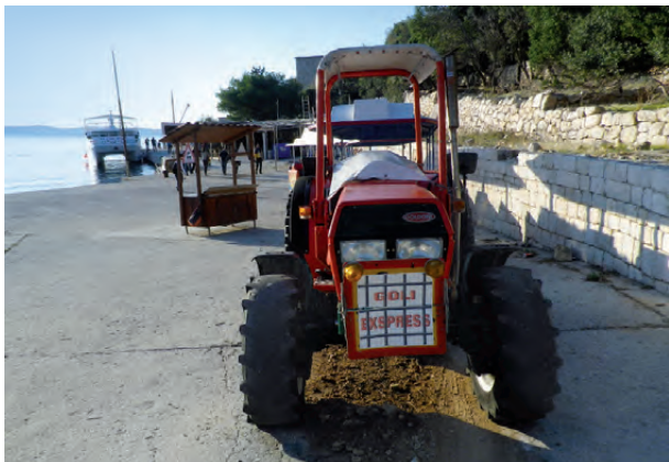
Fotografija pristanišča na Golem otoku leta 2018

Pozitivno je, da je na spominskih slovesnostih na Golem otoku mogoče videti vladne predstavnike ali vsaj njihove odposlance z vencem. Predstavniki političnih institucij Republike Hrvaške obiščejo Goli otok najpogosteje 23. avgusta ob evropskem dnevu spomina na žrtve vseh totalitarnih in avtoritarnih režimov. Toda med pošiljanjem odposlancev z vencem in izgradnjo muzejsko-izobraževalne infrastrukture s kvalificiranim osebjem in programi je dolga pot, ki zahteva precejšnjo vlaganja ter pripravljenost različnih političnih in družbenih akterjev, da podprejo ta postopek.