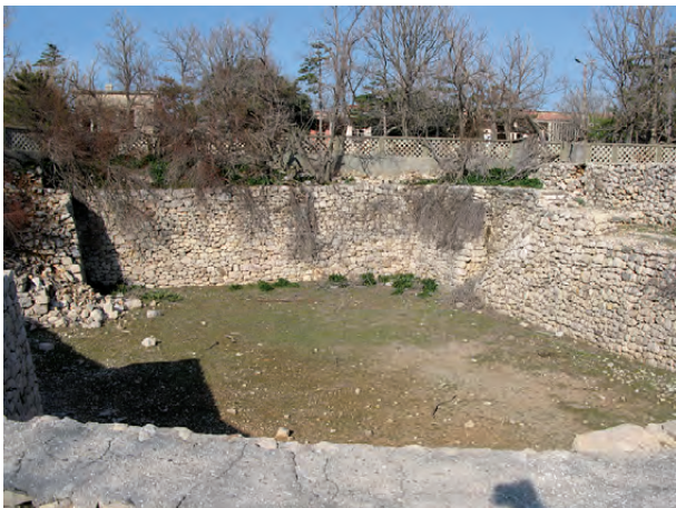
Fotografija ostanka taborišča »Petrova rupa«

Taborišče »Petrova rupa«, imenovano tudi »R-101« in »Manastir«/»Samostan«, je bilo sestavljeno iz velike vojašnice, kjer je bilo interniranih približno 130 ljudi, in manjše opečne zgradbe za taboriščno kuhinjo. Taborišče je bilo zgrajeno v približno deset metrov globoki jami, kakršnih so na Golem otoku izkopal več, ko so v obdobju med obema vojnama iskali rudo boksita. Pridržani so bili večinoma zapriseženi lbeovci, stari komunisti, voditelji Komunistične partije Jugoslavije pred prihodom Tita na oblast, ljudje z dolgoletno službo v Sovjetski zvezi, proslavljeni partizanski poveljniki itd. Vsi ti so bili zaradi svoje dolgoletne partijske zgodovine nenaklonjeni Titu in so večinoma podpirali Stalinovo stran. Da bi jih izolirali od drugih taboriščnikov, so jih postavili na to osamljeno mesto, kjer so bili izpostavljeni hudemu mučenju. Taborišče je bilo po razormiranju zasuto. Fotografija prikazuje lokacijo, kjer je bilo najverjetneje taborišče »Petrova rupa«.