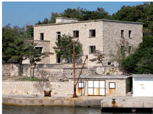
Fotografija kamnite zgradbe

Kamnita zgradba je bila prva zidana zgradba na Golem otoku. Zgrajena je bila leta 1949 z delom zapornikov za potrebe nastanitve uprave taborišča in preiskovalcev. Po končani gradnji novega in večjega objekta za nastanitev uprave in preiskovalcev leta 1950 (glej točko 2) je bila v kamniti stavbi nameščena straža. V kasnejših obdobjih je kamnita stavba pogosto spreminjala svojo funkcijo.