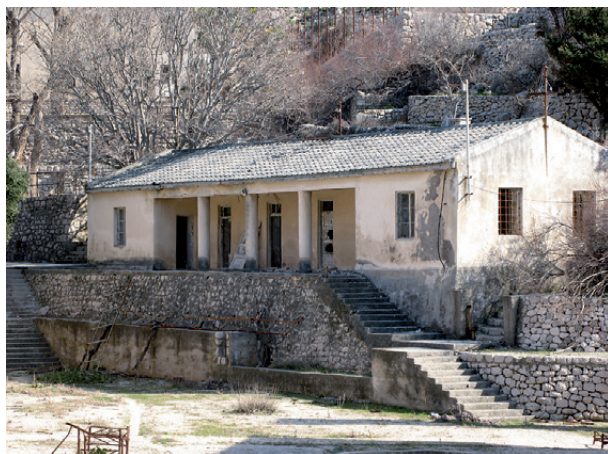
Zgrada centra logorske samouprave

Logor na Golom otoku imao je specifičnu upravnu strukturu. Sama UDBA, jugoslovenska tajna policija, gotovo nikada nije bila prisutna unutar samog logora. Ona je uspostavila strukturu logorske "samouprave" gdje su privilegovani logoraši upravljali ostalim kašnjenicima. Uspostavljen je čitav sistem privilegija i interne logoraške hijerarhije koji je bio poluga „političkog prevaspitanja“. Zgrada "Centar", u kojoj je bio vrh "logoraške samouprave", jedna je od rijetkih autentičnih zgrada u "Žici". Tu su šefovi "samouprave" koordinirali zadatke dobijene od Udbe, sprovodili u djelo radne planove ili primali logoraše i saradnike. Ovo mjesto bilo je posebno omraženo među logorskom populacijom. Naime, zatvorenici su dobro znali da su podobni logoraši smješteni u "Centru" produžena ruka Udbe. Rukovodstvo "Centra" imalo je brojne privilegije o kojima su obični logoraši mogli samo da sanjaju: krevete, neograničenu hranu i piće, pa čak i alkohol. Nijesu morali da rade, ali su naređivali. Inače, slični modeli organizacije, gdje logoraši upravljaju logorašima u ime uprave, mogli su se naći i u nacističkim logorima, kao i u sovjetskim gulazima.