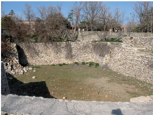
Ostaci logora "Petrova rupa"

Logor "Petrova rupa", alternativnog naziva "R-101" i "Manastir", sastojao se od jedne velike barake gdje je bilo internirano oko 130 osoba, kao i manje zgrade zidane za logorsku kuhinju. Nalazio se u jami dubokoj desetak metara, kakvih je tokom potrage za boksitnom rudom, u periodu između dva svjetska rata, na Golom otoku iskopano nekoliko. Zatvorenici su mahom bili tvrdokorni ibeovci, stari komunisti, lideri Komunističke partije Jugoslavije prije dolaska Tita na vlast, osobe sa dugim stažom u Sovjetskom Savezu, proslavljeni partizanski komandanti, itd. Svi oni, zbog svog dugog partijskog staža, bili su neskloni Titu i mahom su podržali Staljinovu stranu. Kako bi ih izolovali od ostalih logoraša, smjestili su ih na ovo usamljeno mjesto gdje su bili podvrgnuti teškoj torturi. Logor je nakon rasformiranja zatrpan. Fotografija prikazuje lokaciju na kojoj se najvjerovatnije nalazio logor "Petrova rupa".