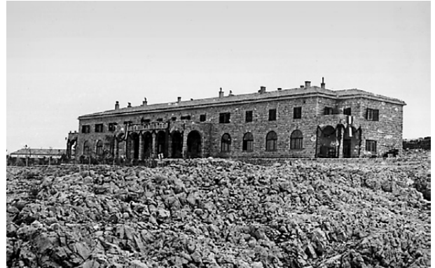
Zgrada tzv. "Hotela"

Takozvani „Hotel“ je zgrada izgrađena tokom 1950. godine. Služila je za smještaj isljednika, pripadnika Udbe (prvi sprat), kao i za isljeđivanje logoraša i ručavanje (prizemlje). Današnja šuma oko „Hotela“ rezultat je pošumljivanja od 1950. godine. Naime, uspostavljanje logora promijenilo je Goli otok i njegovu okolinu. Prostor ispred zgrade izvorno je bio kameni krš, kako se vidi na fotografiji. Uprava logora htjela je da pošumi Goli otok ili bar njegove djelove gdje je to bilo moguće. Zemlja je dovožena sa obližnjih ostrva i korišćena za sadnju drveća, uglavnom borova. Tajna policija je i tu spajala političko prevaspitavanje i prisilni rad. Logoraši su morali satima stajati na mjestu kako bi svojim tijelima štili sadnice od jakog sunca.