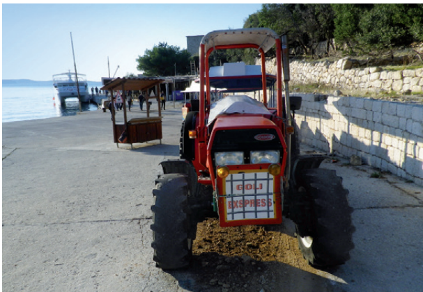
Pristanište na Golom otoku 2018. Autor: Boris Stamenić

Pozitivno je da se predstavnici vlasti, ili barem njihovi izaslanici sa vijencima, mogu vidjeti na godišnjim komemoracijama na Golom otoku. Predstavnici političkih institucija Republike Hrvatske posjećuju Goli otok najčešće 23. avgusta, povodom Evropskog dana sjećanja na žrtve svih totalitarnih i autoritarnih režima. Međutim, između slanja izaslanika sa vijencem i izgradnje muzejsko-edukacijske infrastrukture sa kvalifikovanim osobljem i programima, dug je put koji zahtijeva znatna ulaganja, kao i spremnost različitih političkih i društvenih aktera da podrže taj proces.