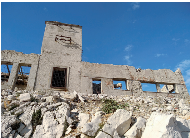
Građevina na Golom otoku 2018.

Činjenica je da su neki od logoraša na Golom otoku bili vatrene pristalice Staljina, što komplikuje situaciju sa priznavanjem statusa žrtve i onim zatvorenicima koji su na Golom otoku završili samo zato što ih je neko zlonamjerno prokazao kao navodne pristalice Rezolucije Informbiroa. Političke elite komunističke Jugoslavije nastojale su da prikriju, odnosno opravdaju političku represiju nad oponentima, što djelimično objašnjava ambivalentan odnos prema Golom otoku u socijalističkoj Jugoslaviji. Čutanje, proizvoljna konstrukcija opravdanja i blaćenje političkih protivnika legitimne su strategije u svakoj diktaturi.