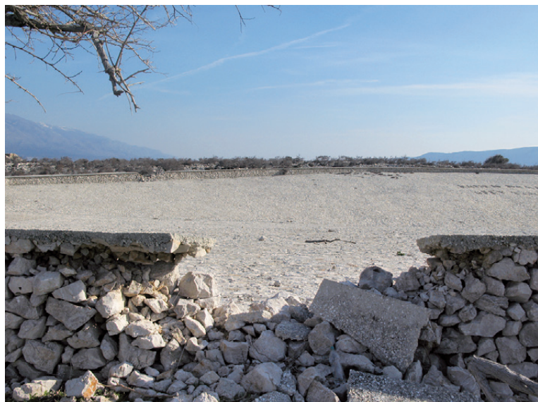
Rezervoar za vodu

Osim što su se logoraši ponekad i kažnjavali manjim porcijama vode, vodu je logistički bilo teško dopremiti na Goli otok. U tu svrhu postojao je brod vodonosac "Izvor" koji je snabdijevao logor. Jedan od načina da se smišljeno doskoči problemu nedostatka vode na ostrvu bila je izgradnja velikog naplava gdje je prikupljana kišnica.